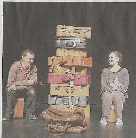
► PP et Virginie : une belle complicité au service de la création

« On a tout repris ! On se chamaille comme des gamins mais on avance. Et pour moi, ce temps de travail est une pure jubilation : on s'autorise à prendre d'autres directions, à tester des choses sans avoir la pression d'une date précise de sortie