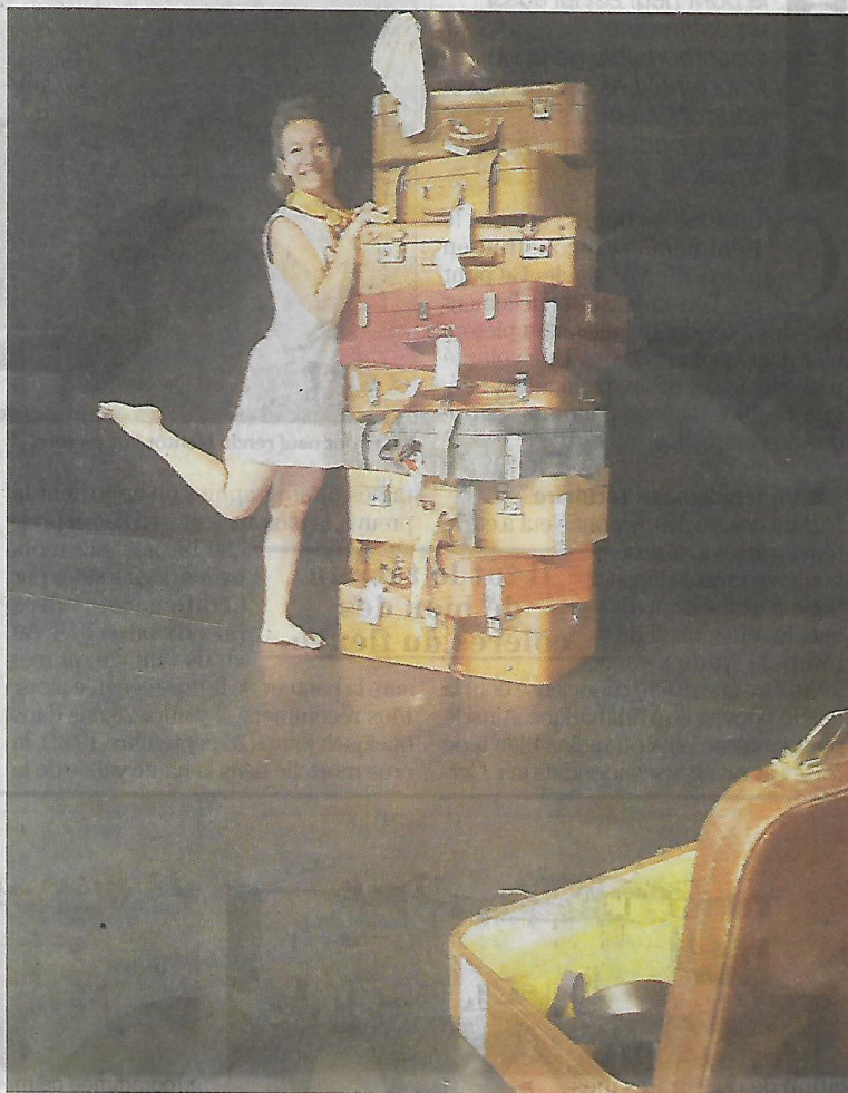
► Mais qui se cache donc dans les valises ?

du malicieux PP qui n'installe jamais les valises-personnages dans le même ordre ! » dit-elle avec un sourire en coin en direction de son fidèle complice technicien. En novembre et janvier prochain, Virginie reposera ses valises ma-